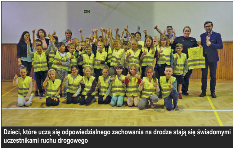
Dzieci, które uczą się odpowiedzialnego zachowania na drodze stają się świadomymi uczestnikami ruchu drogowego

Gmina przekazuje kamizelki odblaskowe dla dzieci ze szkół podstawowych i przedszkoli.